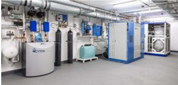
Bild 3: Die Referenzanlage von CYTOK am Ferien- und Freizeitgebiet Bernsteinsee (Niedersachsen) mit Elektrolyseur und Methanisierung